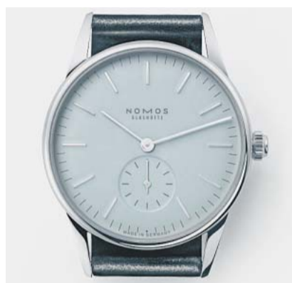
Grau: So wie das Eis in Weißwasser

„Gru, teurer Freund“, belehrt Mephistopheles den Schüler in Faust 1, „grau ist alle Theorie.“ Dass die Praxis auch einmal ziemlich grau sein könnte, konnte selbst Goethe nicht erahnen – gut 140 Jahre vor Gründung der DDR. Entsprechend grau sind die Zifferblätter der Uhren, mit denen die ostdeutsche Uhrmacherei Nomos aus Glashütte den Mauerfall vor 20 Jahren feiert. Die kleine, elegante Orion gibt es in zehn verschiedenen Grautönen und mit gold- oder silberfarbenen Zeigern und entsprechenden Indexen. Neunzehn verschiedene Modelle aus Stahl stehen jeweils für einen Ort aus der ehemaligen DDR: von Budyšin (sorbisch Bautzen) bis Wurzen. Allein die Uhr, die Glashütte symbolisiert, trägt zu grauem Gesicht ein Kleid aus Gold. Eldorado des Ostens? Aber am hellsten graut „Weißwasser“. Denn in dieser kleinen Stadt in der Oberlausitz unweit der polnischen Grenze glänzte früher nur der Eisport. SG Dynamo Weißwasser stellte mit SG Dynamo Berlin lange Zeit die zwei einzigen Mannschaften in der Eishockey-Oberliga der DDR. Mal gewannen die einen, mal die anderen die Meisterschaft – am häufigsten aber standen die Sachen ganz vorn. Auch das hat die Wende umgekehrt: Die in „Eisbären“ umbe-