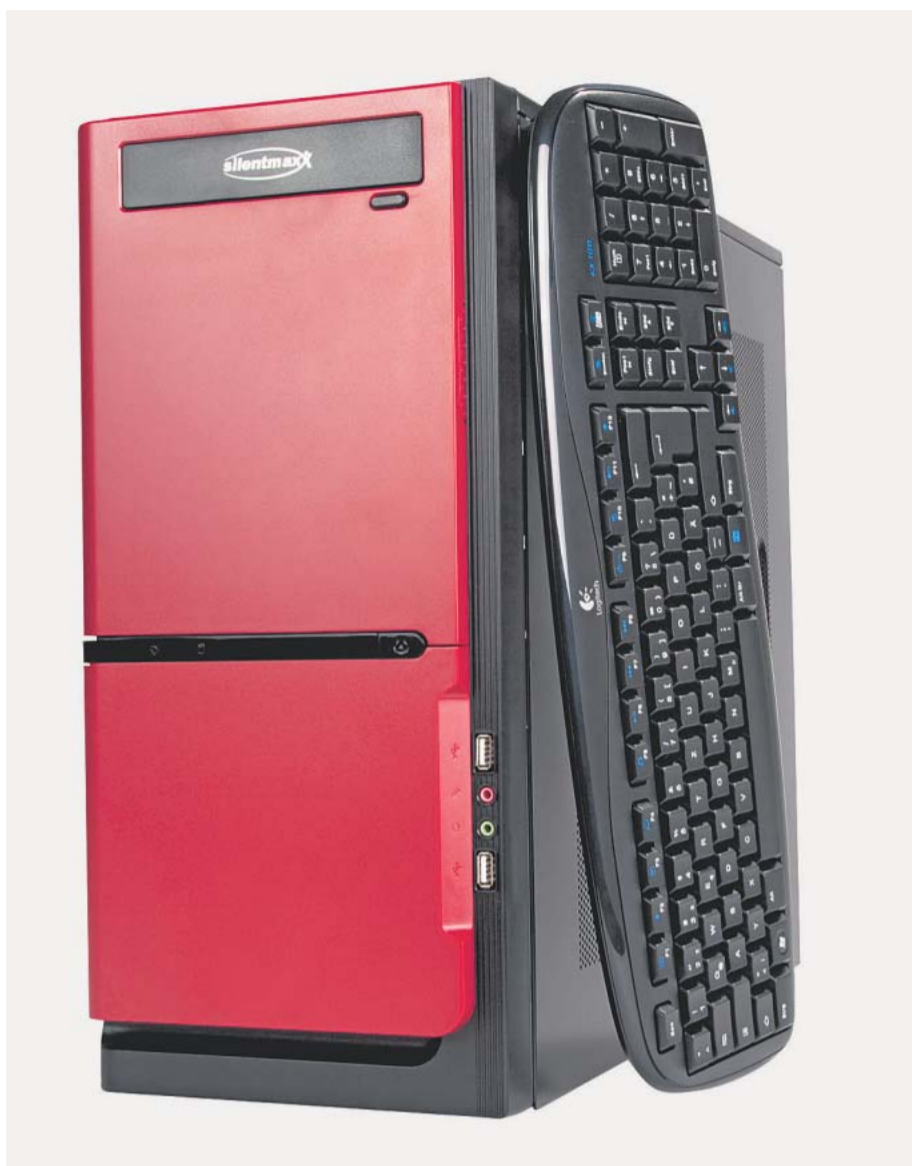
Silentmaxx-PC: Rein äußerlich ein PC wie jeder andere.