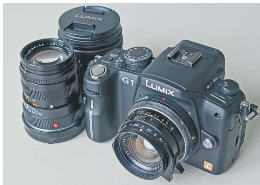
Zwischenlösung: Der Novoflex-Adapter verbindet Summilux und Lumix

Nun sind wir gespannt, ob bald eine dritte Folge über das digitale Fotografieren mit Leica-M-Objektiven folgen kann – sobald Olympus mit seiner Micro-Four-Thirds-Kamera niedergekommen ist. HANS-HEINRICH PARDEY