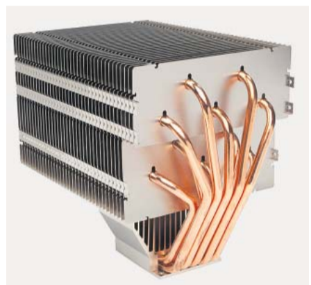
Des Pudels Kern: Der Lüfter

Die Festplatte wird von Silentmaxx mit einer Wärmeleitfolie versehen und in einem Aluminiumgehäuse mit verrippten Außenseiten verstaubt. Die Box heißt „HD Silencer“, im Rechner wird sie mit Gummipolstern aufgehängt, so übertragen sich die Vibrationen nicht aufs Gehäuse. Nachdem wir unseren Wunsch-PC direkt in Rheinbach abgeholt hatten, waren wir auf die Lärmentwicklung im Praxiseinsatz gespannt. Kurz und knapp: Die Leute von Silentmaxx versprechen nicht zu viel. Der „Fanless Intel“ arbeitet nahezu unhörbar. Nur wenn man ein Ohr ans Gehäuse